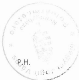
Dr. Kovács Ferenc polgármester

Kelt: Nyíregyháza, 2020. időbélyegző szerint